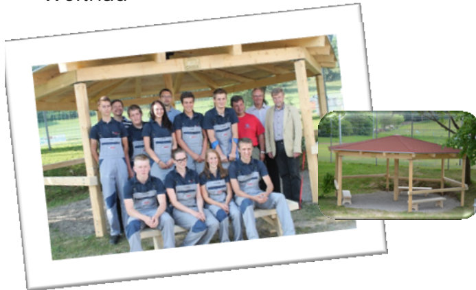
Pergola in der Mittelschule Weitnau