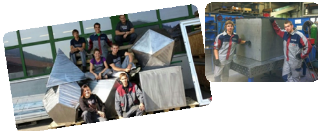
Platonische Körper für Das Gymnasium Oberstdorf