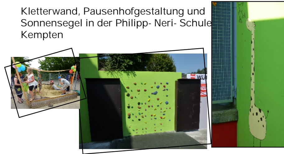
Kletterwand, Pausenhofgestaltung und Sonnensegel in der Philipp- Neri- Schule Kempten